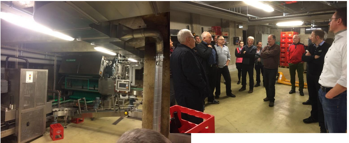
(Klinger – Flaschenwaschmaschine)

Bis im Jahr 2000 war die Fa. Sauser Decolletage mit bis zu 250 Mitarbeitern in diesem Gebäude tätig. Das 11i-Bier wurde ca. 15 Jahre auswärts bei der Fa. Felsenau gebraut. Erst seit einem Jahr wird es vor Ort produziert. Die Zwischenböden wurden herausgerissen damit die Zylindrischen Gär- und Lagertanks Platz fanden. Die Firma 11i-Bier braut bis zu 30 verschiedene Biersorten und bis zu ½ Million Liter pro Jahr. Im Sommer wird an 2 Tagen und im Winter an 1 Tag pro Woche gebraut. Es bestehen nur sehr schwache Emissionen; der Restdampf, nach Kondensatoren/Filtern, wird über den First abgeführt.